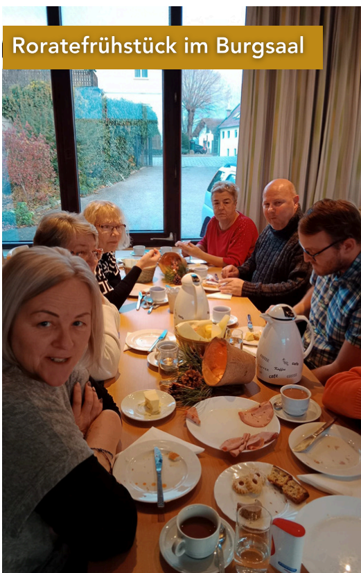
Roratefrühstück im Burgsaal