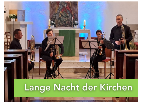
Lange Nacht der Kirchen