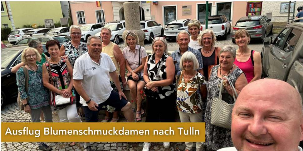
Ausflug Blumenschmuckdamen nach Tulln